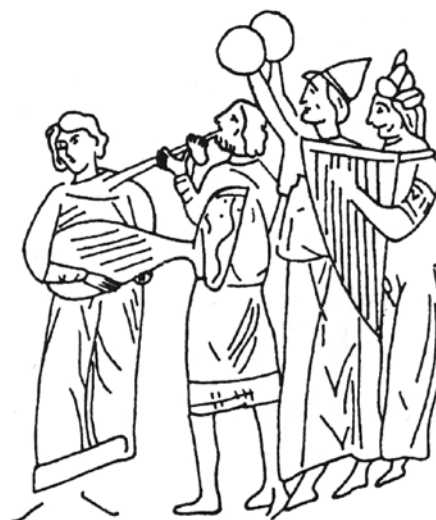
Сл. 6 Музичари Минијатура од хрониката на Јован Скилицја Мадрид. Втора половина на XIII век Fig. 6 Musicians depicted on a mid-13 th century miniature in the Synopsis of Histories by John Skylitzes. Madrid.