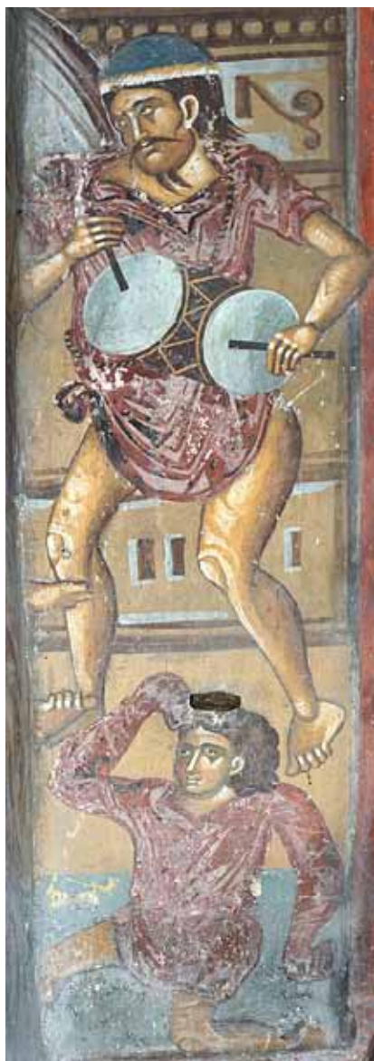
Сл. 9 Исмејувањето Исусово. Фреско живопис Св. Ѓорѓи, Полошки манастир, Средина на XIV век Fig. 9 The Mocking of Christ on the Road to Golgotha. Fresco in Pološko Monastery, From a mid-14 th century.