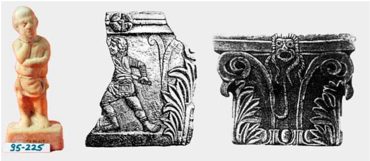
Сл. 1а-с Археолошки остатоци од театарските игри: а) Мимичар, б) Капител со венатор в) Капител со трагична маска. Антички град - Стоби

Fig. 1a-c Archaeological items from public theatrical entertainments: a) a mime artist; b) a capitol decorated with an illustration of a venator; c) a capitol decorated with a tragic mask. From the ancient city of Stobi.