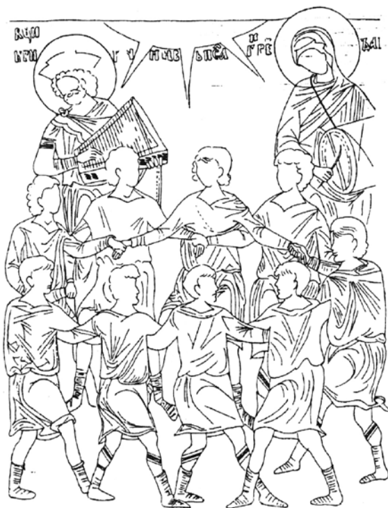
Сл. 7 Илустрација на Давидовиот псалм 149 „Фалете го Господа со игри“, Лесново фреско живопис. Средина на XIV век Fig. 7 A mid-14 th century illustration of Psalm 149, Praise God with dancing. From a fresco in Lesnovo.

Според евангелијата на Матеј и Марко, Исус Христос одејќи по via doloresa на патот кон Голгота, поминувал низ повеќе искушенија и тегобни случувања. Едно од нив била и средбата со лакрдијашите – скомрахи. Тие со своите играрији требало кајно да го понижат Исуса, да го „крунисаат“ со трнливиот венец како да е, божем, цар. На крајот на ова „исмејување“ тие цинично го прославувале неговото „царско“ владеење со разврдани игри, песни и забава. 24 (Сл. 8, 9, 10)