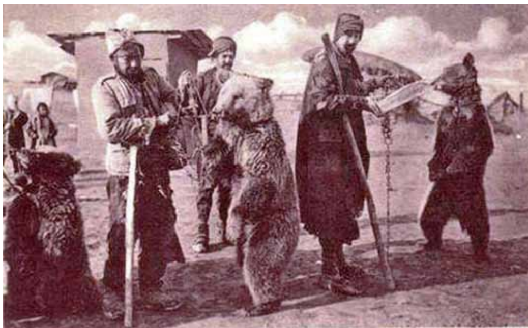
Сл. 15 Игри на дресери со мечки Средно Повардарје Македонија, XX век. Fig. Entertainments by bear-trainers. Central Vardar region, Macedonia, 20 th century.