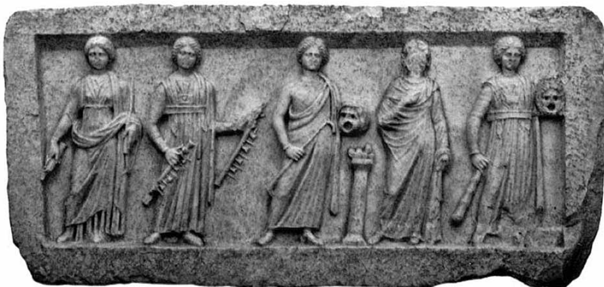
Сл. 2 Мермерна плоча со претстави на музи Антички театар – Лихнид Fig. 2 A marble slab depicting the Muses, from the Antique Theatre in Lychnidos (Ohrid)

ран костим. 11 Тоа е литургискиот театар. Тој содржел библиски сижеа и сцени и имал поучен карактер. Неговата цел била насочена кон гледачот кој требало, на тој начин, да се соживее со верата. 12