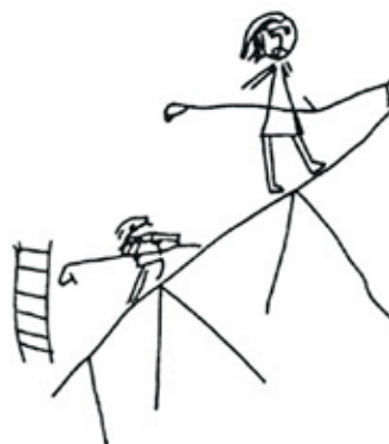
Сл. 12 Графит – Одачи по јаже. Св. Петар и Павел Велико Трново Бугарија XVI-XVII век