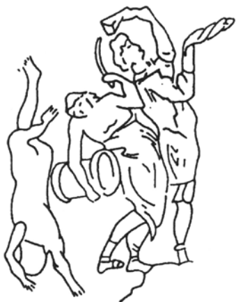
Сл. 10 Сцена од „Крунисувањето со трнов венец“, Лакрдија-ици фреско живопис Иваново, Бугарија, средина на XIV век Fig. 10 Scene from the 'Coronation' of Christ, with jesters. From a mid-14 th century fresco in Ivanovo, Bulgaria.