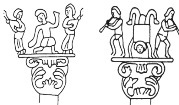
Сл. 5 Скомрахи и акробати со лаутисти и флејтисти, Минијатури од византиски ракопис Оксфорд XII век Fig. 5 Scomrahi and acrobats, with lutists and flautists, depicted in 12 th century miniatures Byzantine manuscripts. Oxford.