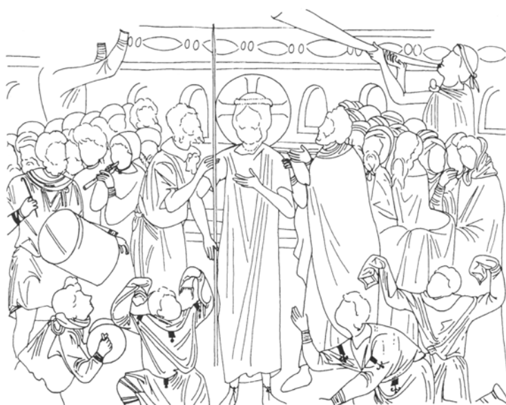
Сл. 8 Исмејувањето на Исус на патот кон Голгота. Фреско живопис Старо Нагоричане 1318-1320 Fig. 8 The Mocking of Christ on the Road to Golgotha. Fresco in Staro Nagoričane, 1318-1320

игрите се одвивале во средината на игралиштето, а актерите излегувале и поново се враќале во публиката која стоела кружно поредена околу „сцената“. 26 Сето тоа доста наликувало на италијанската comedia del'arte .