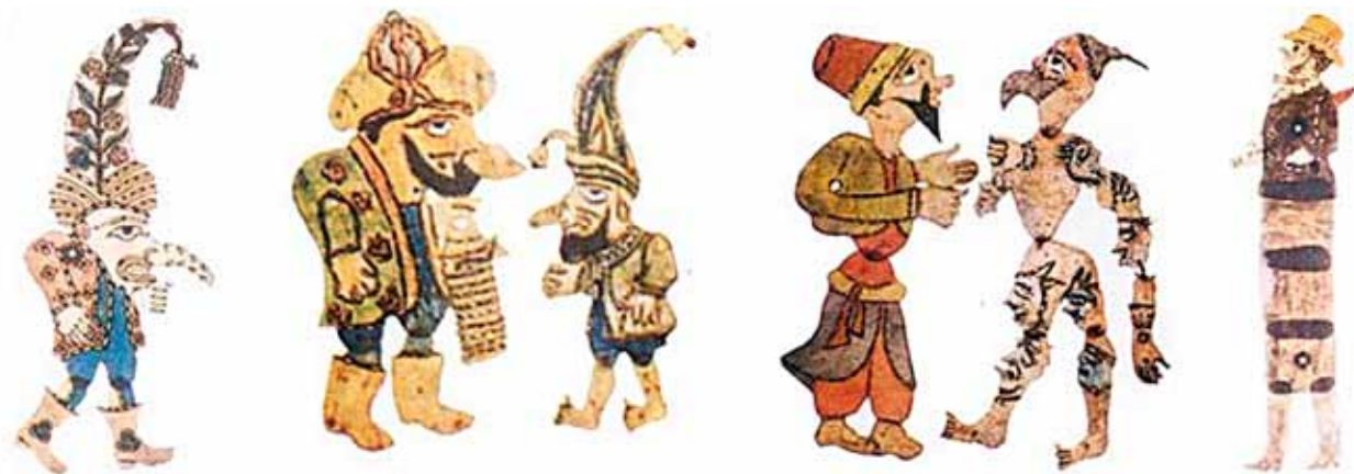
Сл. 13 Ликови од „театарот на сенки – Караџоз“, Османлиски период Fig. 13 Characters from Karagoz shadow-theatre of the Ottoman period.