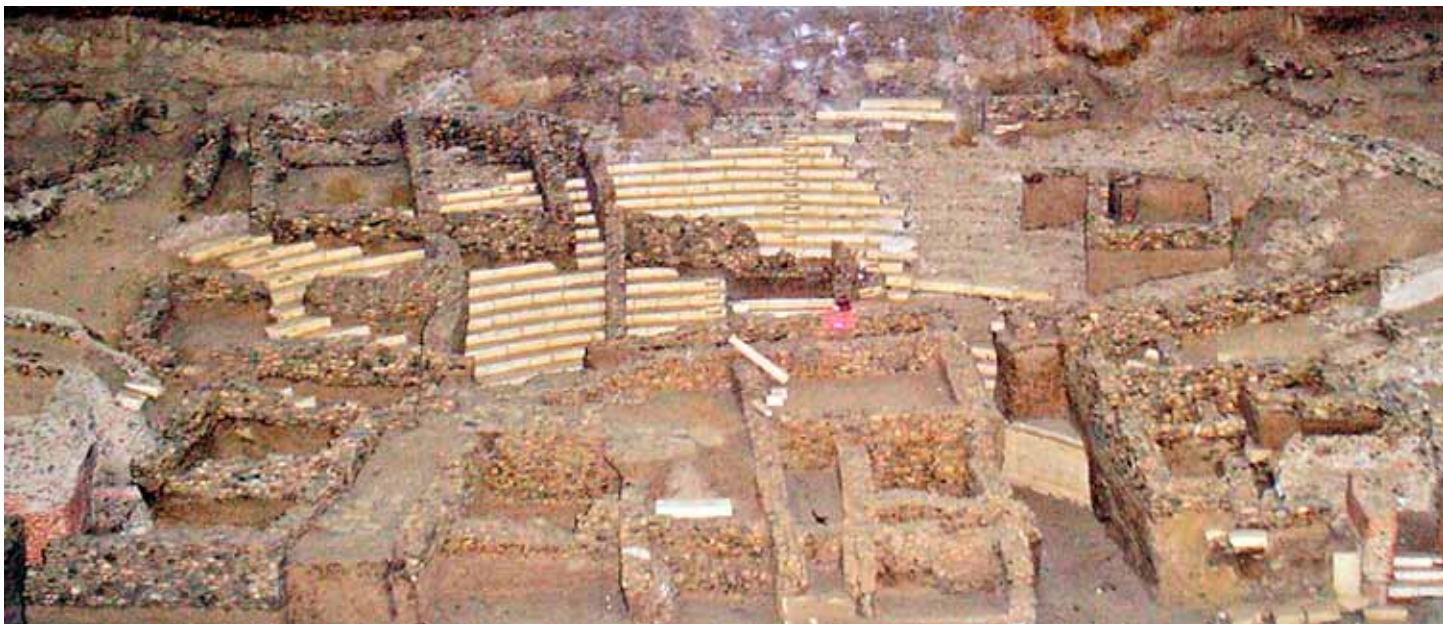
Сл. 3 Археолошки остатоци од римскиот театар надслоен со рановизантиски, профани градби Хераклеа Линкестис Fig. 3 Archaeological remains of a Roman theatre, later replaced by secular buildings in the Early Byzantine period. Heraclea Lyncestis / Bitola

За театарот од Просек, монахот Теодосиј, биографот на св. Сава, го вели следното: „... (Стрез) многу се збогати (...) се здебели и се рашири со безумие и заборава на Бога (...). го утврди својот дом на карпата во повеќе пати споменатиот Просек, а тие карпи беа многу високи, од 200 сажни и повеќе, под кои веднаш тече големата река по име Вардар. На тие карпи, значи, премостувајќи ги со штици, направи свој театар . Кога бедникот сакаше да се весели, тој тука седнуваше пијанчејќи на одвратната смртна судница, играјќи и веселејќи се. А веселбата негова беше смрт човечка, и за мала вина го осудуваше виновникот на смрт и му заповедаше да се фрли од оние високи карпи, од оној театар . Кога неког така го фрлаа, тој весел извикуваше, „Внимавај да не го наквасиш коживот“, зашто фрлениот немаше каде да падне освен во самата река“... 19 (Сл. 4)